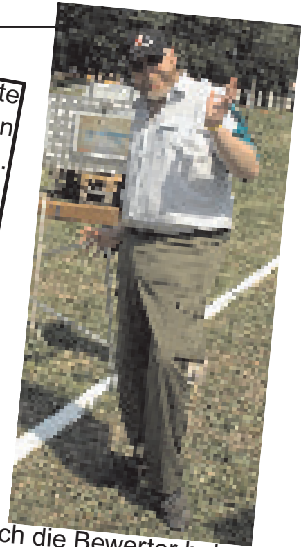
auch die Bewerber haben ihre Spaß

Sanitäter suchen Experten im Vorzeltbau. Meldungen unter "SAN-KISTE" bei den Sanitätsstelle