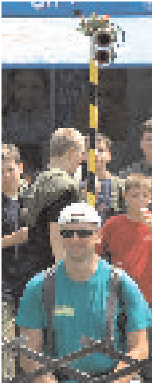
Alleinunterhalter mit Soundgerät(2m 2 Becher) kommt zu euch. Chiffre "Kravalle" an die Redaktion

Einsamer RLF-Driver sucht nette Beifahrerin für die Fahrt auf den einsamen Lagerstraßen. Anforderungen: Wattiefe mind. 1m, Autobahntauglichkeit. Meldungen an die FF Aspang